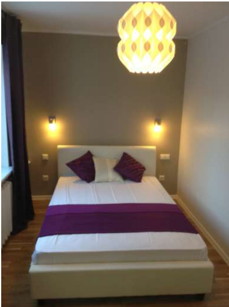
Magamistuba on täielikult sisutatud, lisaks voodile asub seal mahukas liugustega garderoob.