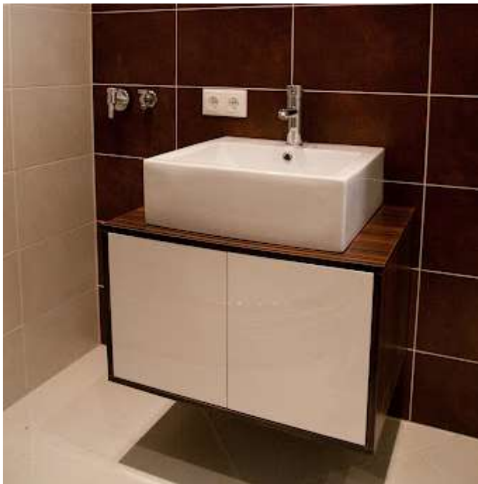
Vannituba ehitati suuremaks, kuhu planeeriti vann, põrandaküte ja eritellimusel valmistatud vannitoamööbel.